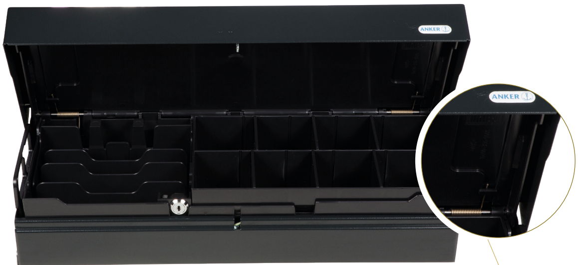
Innenkassette mit Deckel