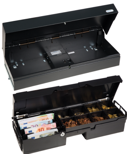
Außenkassette und bestückte Innenkassette